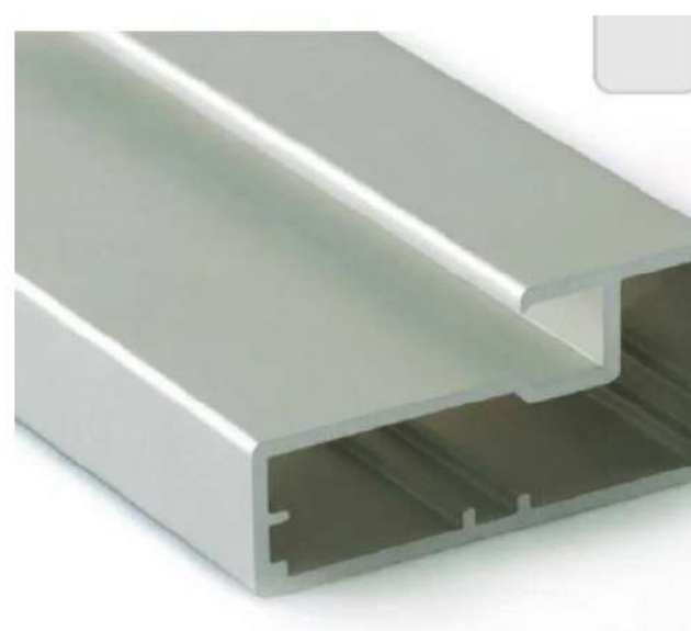
Широкий ал. профиль