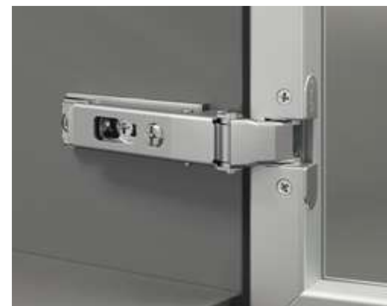
Спецпетля для узкого профиля