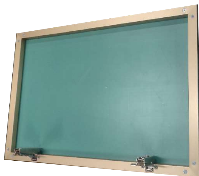
Витрина из узкого профиля

Вы можете заказать в цветах: серебро, черный, шампань, коньяк и золото. Фрезеровка в широком профиле делается под стандартную петлю d 35 мм, в узком по спец. петлю.